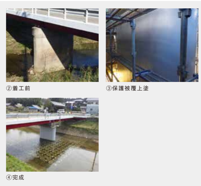
施工/(株)安部日鋼工業