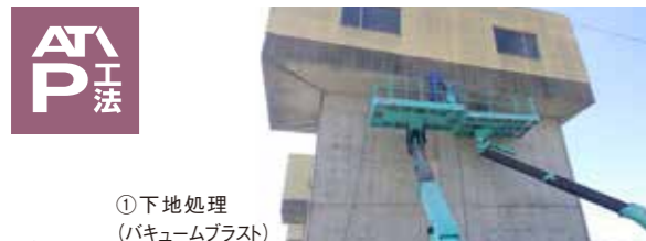
①下地処理 (バキュームブラスト)