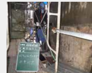
②下地処理(バキュームブラスト)