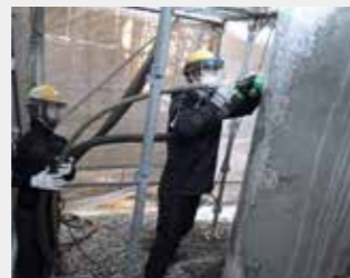
②下地処理(バキュームブラスト)