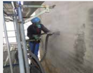
②下地処理(バキュームブラスト)