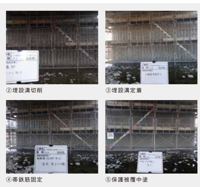
施工/(株)横浜システック